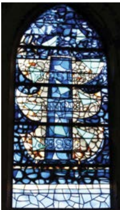
Arbre de Jessé, vitrail de Georges Braque, Varengeville sur Mer

Comme beaucoup, je me suis associé à la douleur, comme beaucoup j'ai au fond de moi une grande indignation, condamnant le terrorisme, acte ignoble revendiqué au nom d'une idéologie religieuse meurtrière, où se côtoient le racisme et de la haine. Cet élan de solidarité que nous avons vécu le 11 Janvier 2015 était un élan magnifique, un élan de fraternité émouvant, et ne nous le cachons pas, qui fait du bien. Mais faut-il craindre cet élan éphémère ? Retomberons-nous, dans quelques semaines, dans l'indifférence vis à vis des juifs ou des musulmans, entre autres, qui vivent dans un quotidien de menaces, d'injures, et d'agressions ?