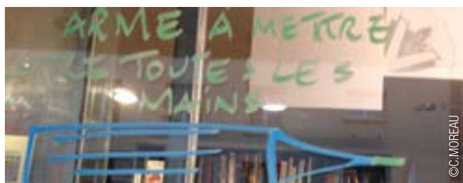
Manifestation du 10 janvier à Rouen. Légende : "Arme à mettre entre toutes les mains"

Le respect est à la base de toute vie en société. Reste à chacun de reconnaître à l'autre de croire comme il veut ou de défendre ses idées, à condition qu'elles ne prônent aucunement la violence, l'exclusion, le racisme. Cette liberté d'expression est garantie par la laïcité inscrite dans notre constitution (cf encart).