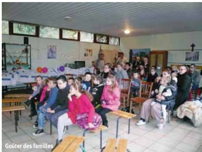
Goûter des familles