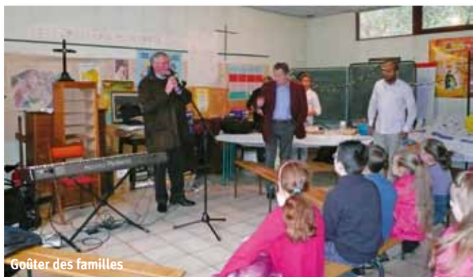
Goûter des familles