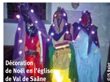
Décoration de Noël en l'église de Val de Saône